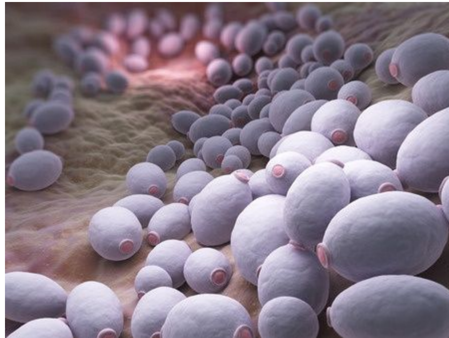
Imagen de Candida albicans